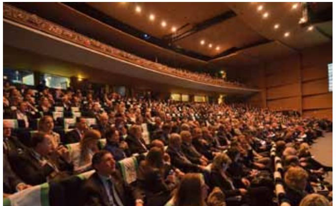
Kongressalen i Marseilles var fyldt til bristepunktet til EPP-topmødet.

European People's Party (EPP) – det europæiske parti, som Det Konservative Folkeparti er en del af. Læs mere på side 17, hvor Politisk Horisont beskriver vores europæiske paraplyparti.