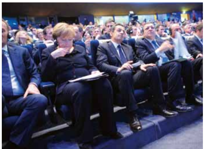
EPP-kongressen er på vej til at gå i gang. Prominent udsnit af konservative partilederkolleger med premierminister Donald Tusk (Polen), kanster Angela Merkel (Tyskland), præsident Nicolas Sarkozy (Frankrig), kommissionsformand José Manuel Barroso (EU), præsident Traian Băcescu (Rumænien), premierminister Pedro Coelho (Portugal) og premierminister Lawrence Gonzi (Malta).