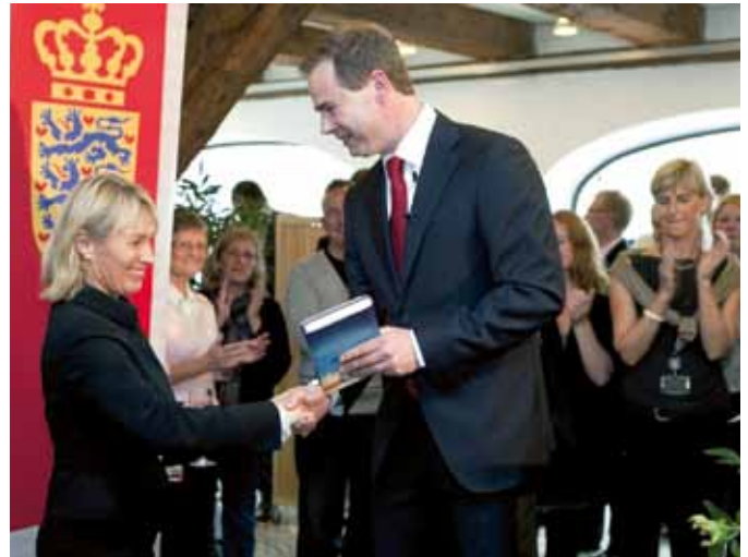
Lene Espersen overdrager dele af sit Udenrigsministerium til Nikolaj Wammen, og vi overdrager "gæstepennen" i Politisk Horisont til den ny europaminister.

Selvom krisen kradsler i EU, og situationen i en række EU-lande balancerer på en knivsæg, må vi i EU ikke miste overblikket og glemme de mere langsigtede udfordringer.