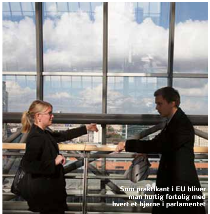
Som praktikant i EU bliver man hurtig fortolig med hvert et hjørne i parlamentet