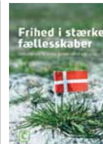
Frihed i stærke fællesskaber Vi ønsker et samfund med personlig frihed i stærke fællesskaber. Det er de værdier og den politik, vi skal præcisere med vores kommende parti-program

Rammen om diskussionerne og debatterne om et nyt parti-program ude i vælgerforeningerne, i storkredsene, i ungdomsorganisationerne er fire