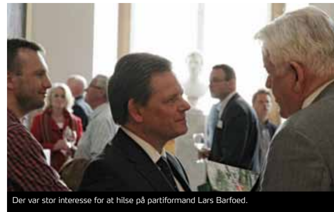
Der var stor interesse for at hilse på partiformand Lars Barfoed.