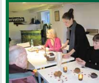
Efter hver aktion mødes man typisk i hyggelige rammer og deler erfaringer fra dagens aktion.

ganisation kan være med til at understøtte det lokale. De frivillige kampagneteams har i alt sat en målsætning om at besøge 100.000 husstande inden valget.