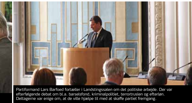
Partiformand Lars Barfoed fortæller i Landstingssalen om det politiske arbejde. Der var efterfølgende debat om bl.a. barselsfond, kriminalpolitiet, terrortruslen og efterløn. Deltagerne var enige om, at de ville hjælpe til med at skaffe partiet fremgang.