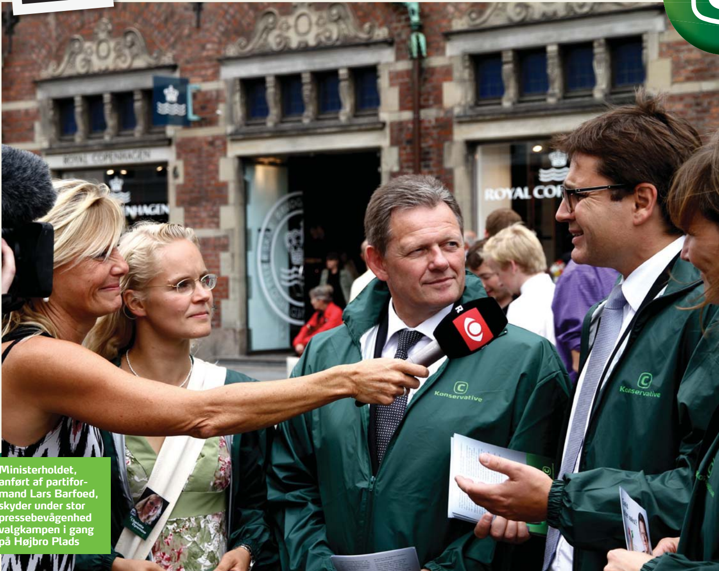
Ministerholdet, anført af partiformand Lars Barfoed, skyder under stor pressebevågenhed valgkampen i gang på Højbro Plads