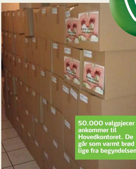
50.000 valgpjecer ankommer til Hovedkontoret. De går som varmt brød lige fra begyndelsen