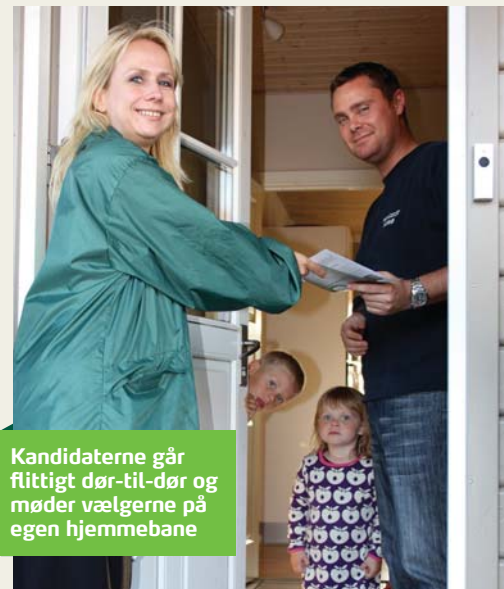
Kandidaterne går flittigt dør-til-dør og møder vælgerne på egen hjemmebane

Det konservative kandidathold havde allerede været klar længe, da Lars Løkke Rasmussen trykkede på valgknappen fredag den 26. august, så fra første færd var ministre, folketingsmedlemmer og -kandidater på gaden for at kapre de første vælgere. De blev blandt andet bakket op af Konservatives to eventteams, som under hele valgkampen kører landet tyndt i deres kampagnebiler.