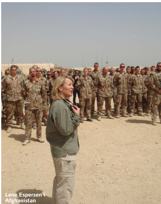
Lene Espersen i Afghanistan

Lene Espersen har fra begyndelsen af sit liv i politik været helt sin egen. Som justitsminister gennem over syv år blev hun blandt sine europæiske kolleger kendt for sin uformelle og resultatorienterede stil. Lene Espersen var på fornavn med sine kolleger og gik til det internationale samarbejde med en moderne facon, som brød barrierer ned og gjorde samarbejdet om tunge emner som terror og grænseoverskridende kriminalitet lettere og mere effektivt.