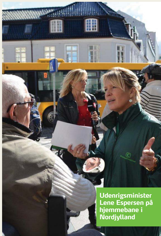
Udenrigsminister Lene Espersen på hjemmebane i Nordjylland