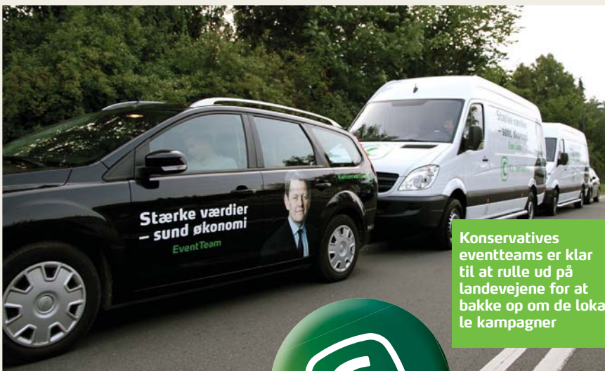
Konservatives eventteams er klar til at rulle ud på landevejene for at bakke op om de lokale kampagner