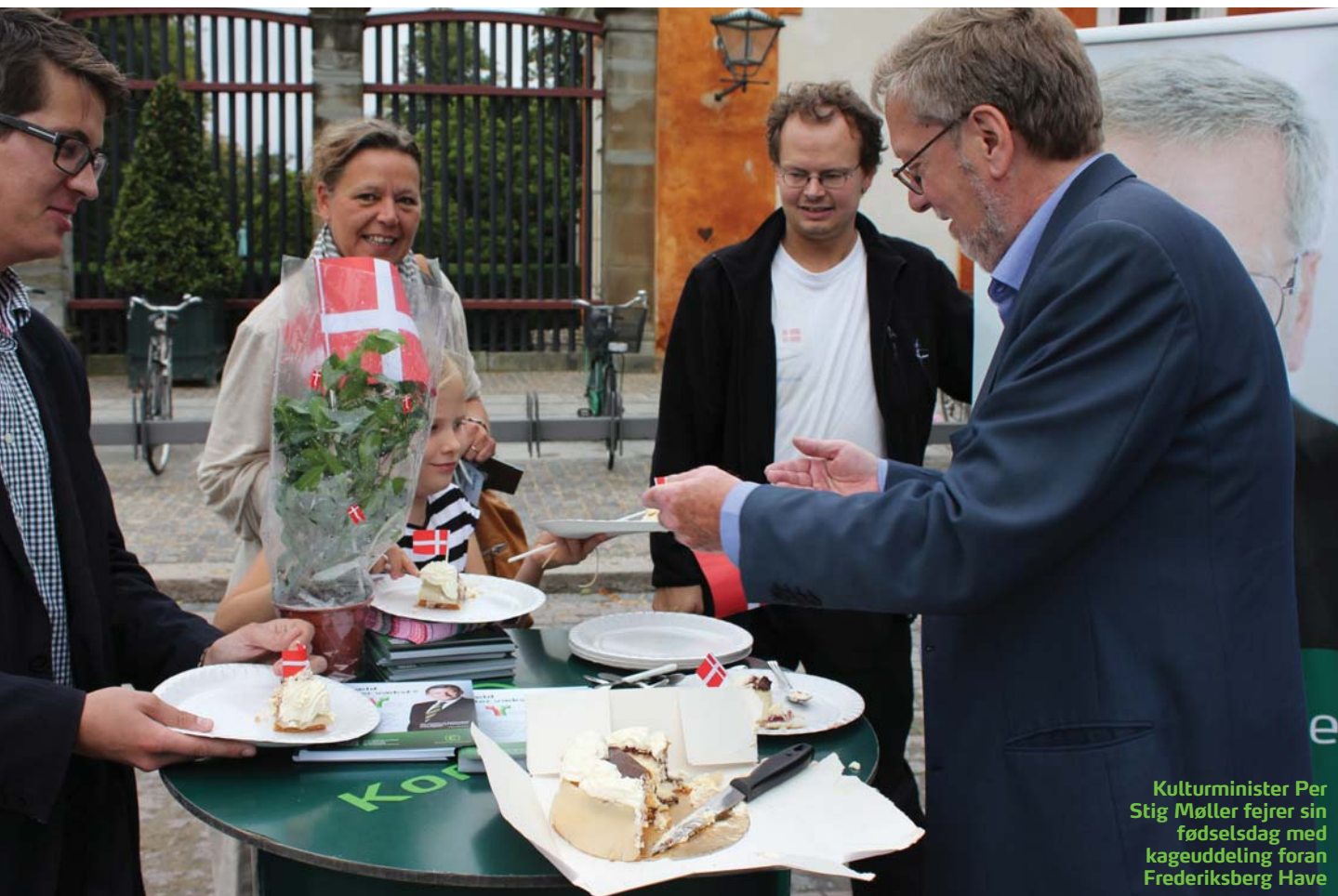
Kulturminister Per Stig Møller fejrer sin fødselsdag med kageuddeling foran Frederiksberg Have

mennesker behandles lige, ligesom vi gør i Danmark," fortæller Per Stig Møller.