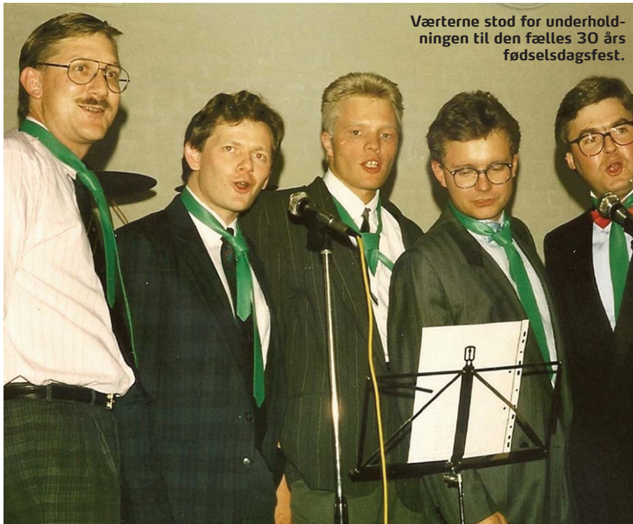
Værterne stod for underholdningen til den fælles 30 års fødselsdagsfest.