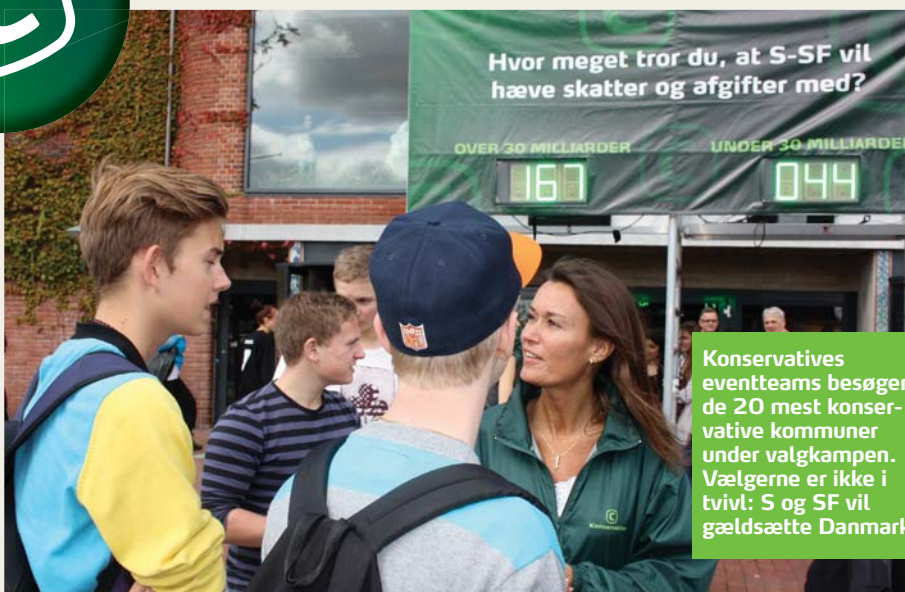
Konservatives eventteams besøger de 20 mest konservative kommuner under valgkampen. Vælgerne er ikke i tvivl: S og SF vil gældssætte Danmark