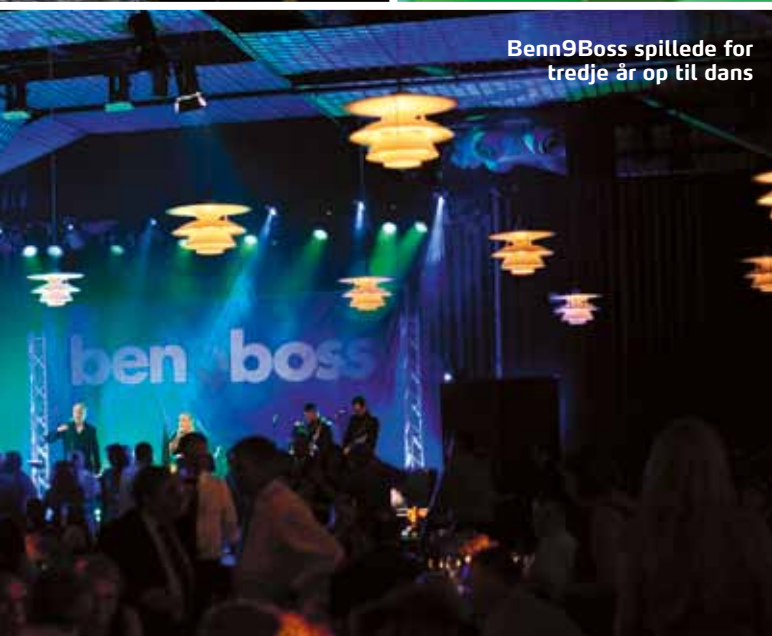
Benn9Boss spillede for tredje år op til dans