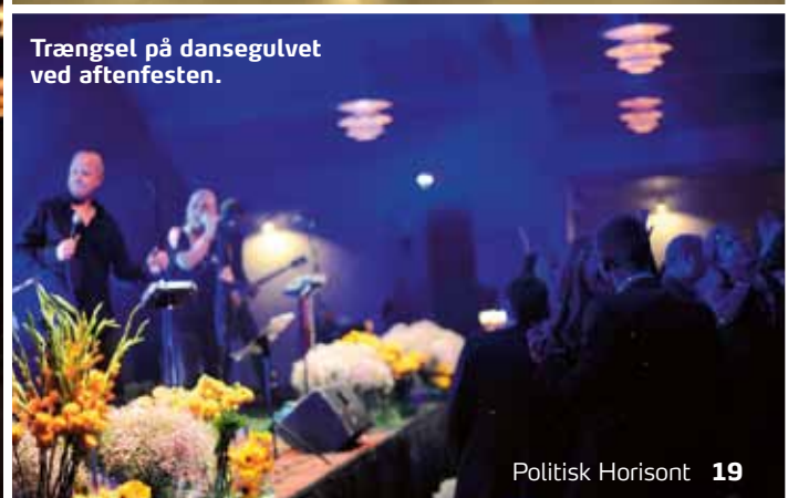
Trængsel på dansegulvet ved aftenfesten.