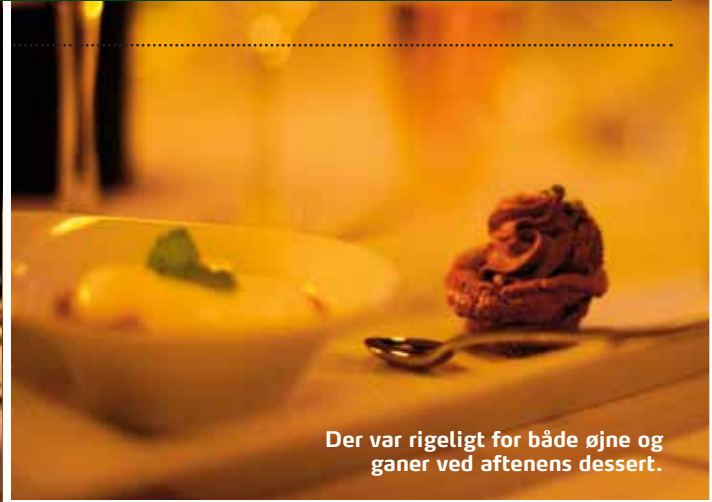
Der var rigeligt for både øjne og ganer ved aftenens dessert.