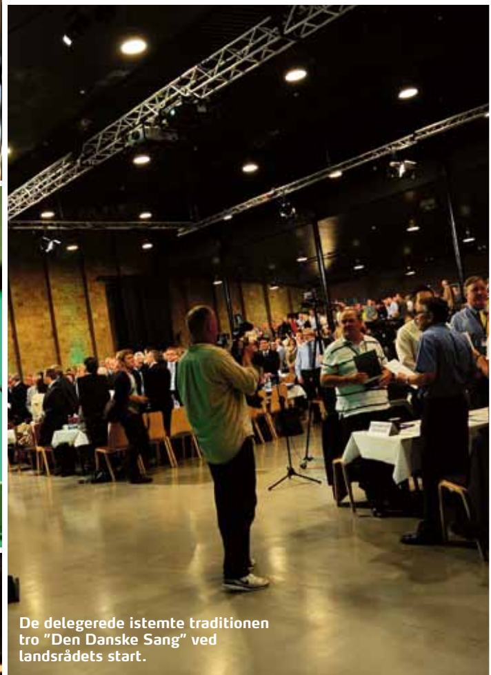
De delegerede istemte traditionen tro "Den Danske Sang" ved landsrådets start.